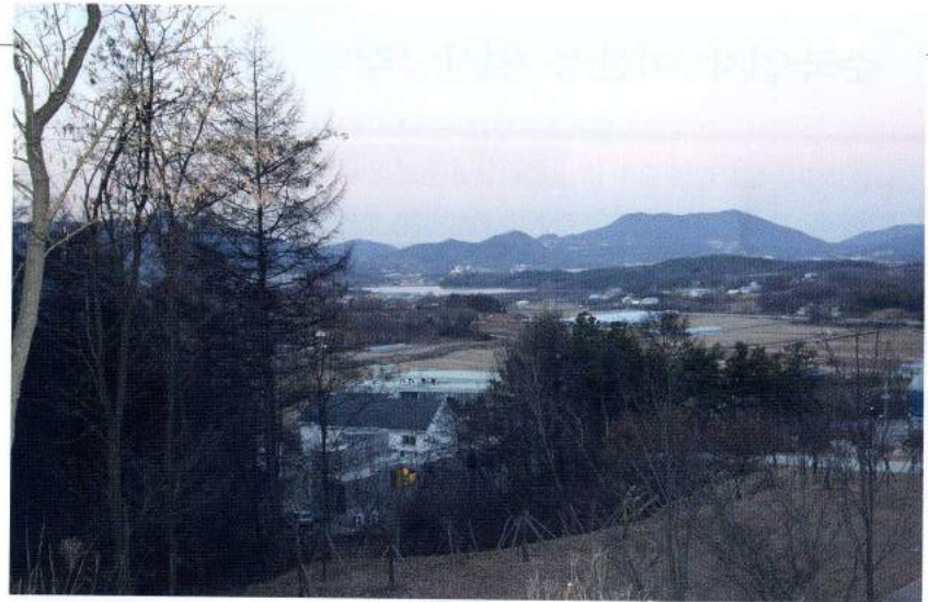
〈원삼면 안골 전경〉

조선총독부 『관보』에 따르면, 일제는 1912년부터 원삼면 일대 금광채굴을 허가해