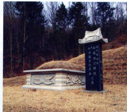
홍종엽 묘(용인시 처인구 포곡면 금어리)