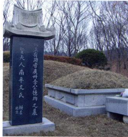
이덕균 묘(용인시 수지구 고기2동)