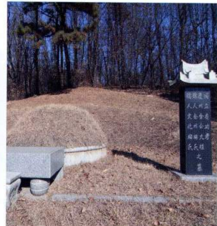
김구식 묘(용인시 기흥구 하갈동)