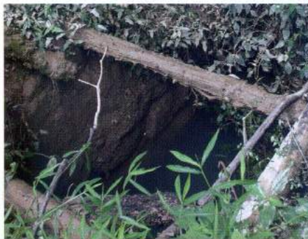
〈사금광 지하갱도(현재는 메워졌음)〉

용인 원삼면 사암리 안골은 일제 치하 당시 금광이 발견된 이래, 엄청난 변화를 겪었으며 인구도 급증하였다. 석금광을 중심으로 사금광이 혼재했던 1940년대의 안골은 마을 앞 농토가 금광 개발로 인해 황폐화될 수밖에 없었고, 이에 따라 주민들이 광산노동자로 전업했다. 광산은 마을에 여러 가지 폐해를 몰고 왔다. 토지와 가옥, 무덤 등을 가리지 않고 파헤쳐졌으며 마을에 소란함이 끊이지 않았다. 현재 현산중학교 뒤에는 채굴이 이루어졌던 폐광이 아직 남아있어 당시의 흔적을 보여준다.