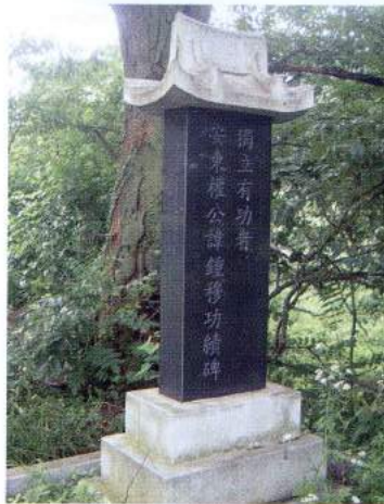
권중목 공적비(용인시 처인구 포곡면 삼계리)