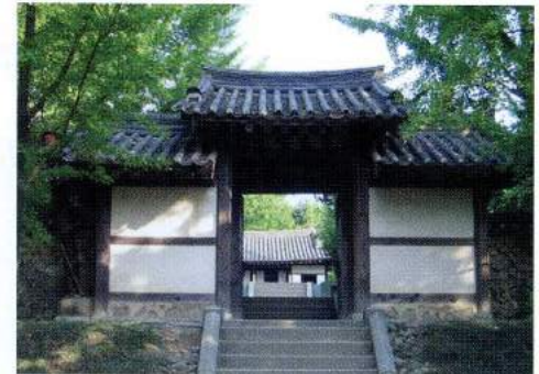
〈충현서원 및 충절사〉

현재 한국민속촌에 있는 충현서원의 충절사에 정몽주·오달제·민영환과 함께 위패가 봉안되어 춘, 추향제를 봉행하고 있다. 2012년 2월 국가보훈처는 김석진을 이달의 독립운동가로 선정하였다.